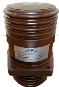
Рисунок 3.1 Вид спереди

Общий вид изделия представлен на рисунке 3.1