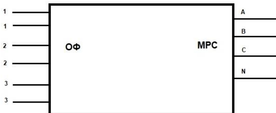
Рисунок 4.2.1. Схема подключения МРС.

Установленное и закрепленное изделие подключается к фазным шинам и нейтрали электросети посредством проводов, подключенных к клеммной колодке изделия. Электросеть должна быть обесточена. Схема подключения показана на рис. 4.2.1. Метод подключения и количество контактов зависит от варианта исполнения, а также от условий конкретного объекта.