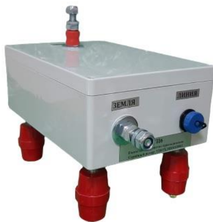
Рисунок 3.1 Внешний вид