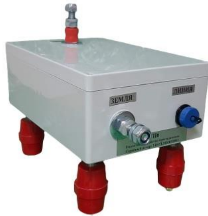
Рисунок 3.1 Внешний вид