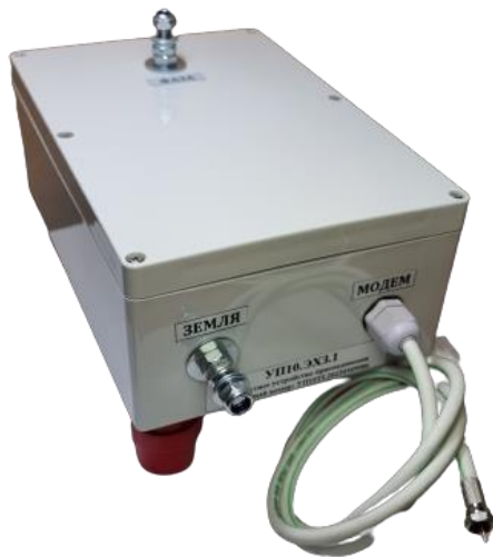
Рисунок 3.1 Внешний вид